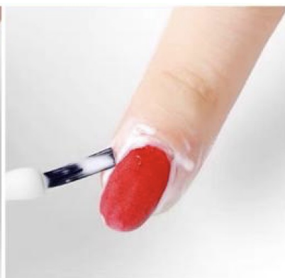
Pensle Repair Cream på huden rundt neglen, da unngår du unødig hudkontakt med removeren