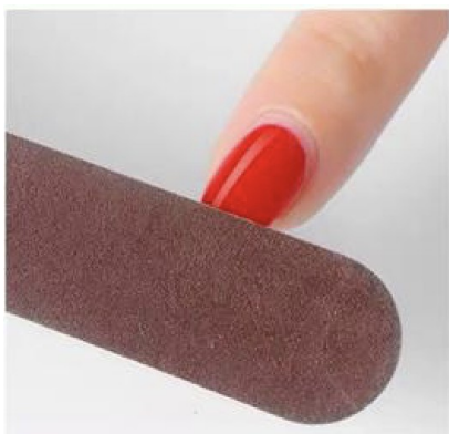
Fil ned overflaten på gelelakken/kunstneglen til den blir matt, da får Gel Remover bedre tak