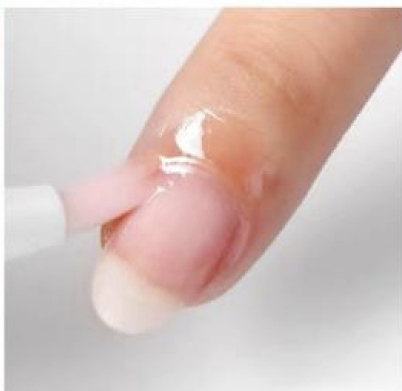
Skal du ikke legge ny gelelakk/kunstnegl med det samme, pensle på neglebåndsolje