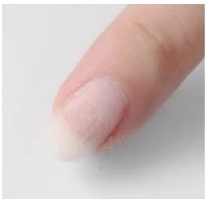
Vask hendene i godt såpevann. Du er nå klar for å legge ny gelelakk/kunstnegl