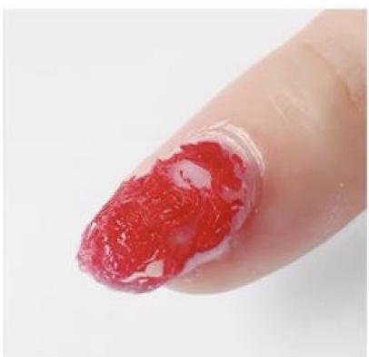
Pensle på Gel Remover, vent to til ti minutter, avhengig av kunstnegltype